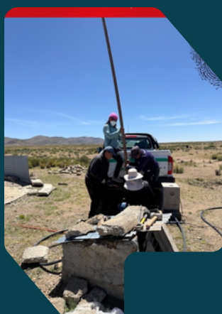
Argentina Acceso al agua Jujuy