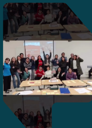
Perú - Semillero de proyectos