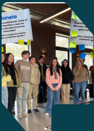
Uruguay - Agentes de cambio